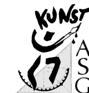
Keramik / Werken Grafik-Design

Basketball Volleyball Handball Tennis Fußball für Mädchen Schach